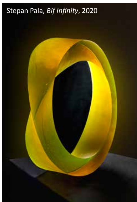
Stepan Pala, Bif Infinity , 2020