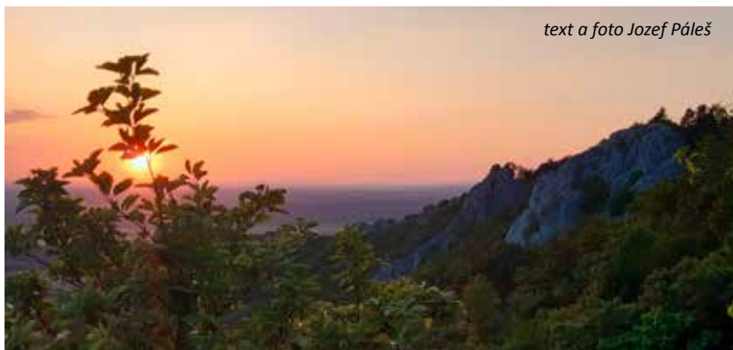
text a foto Jozef Páleš

No a keby ste náhodou nevideli, či nezažili niečo z toho, čo je hore napísané, nič si z toho nerobte. Buď vám nevyšlo počasie, alebo je v tom niečo iné. Veď také popoludnie sa dá stráviť v Devíne aj v kaviarni či na pive. Ale verte mi, že po takej túre a pri tých spomienkach tá káva i pivo chutia určite lepšie.