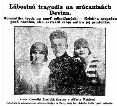
Fotka trojice samovrahov (Slovenský denník, 23.11.1930, s. 3)