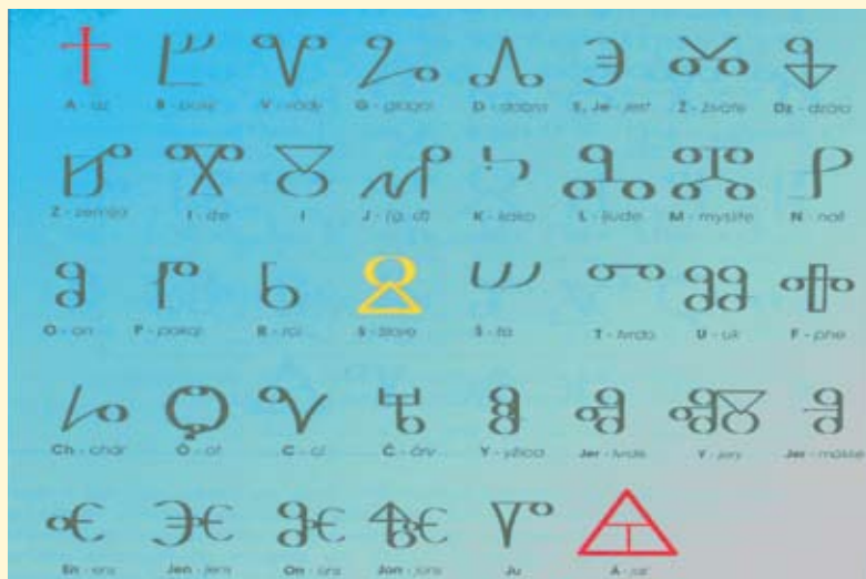
Hlaholika, prekreslila Elena Šubjaková (z publikácie Hlaholika posvätné dedičstvo otcov)