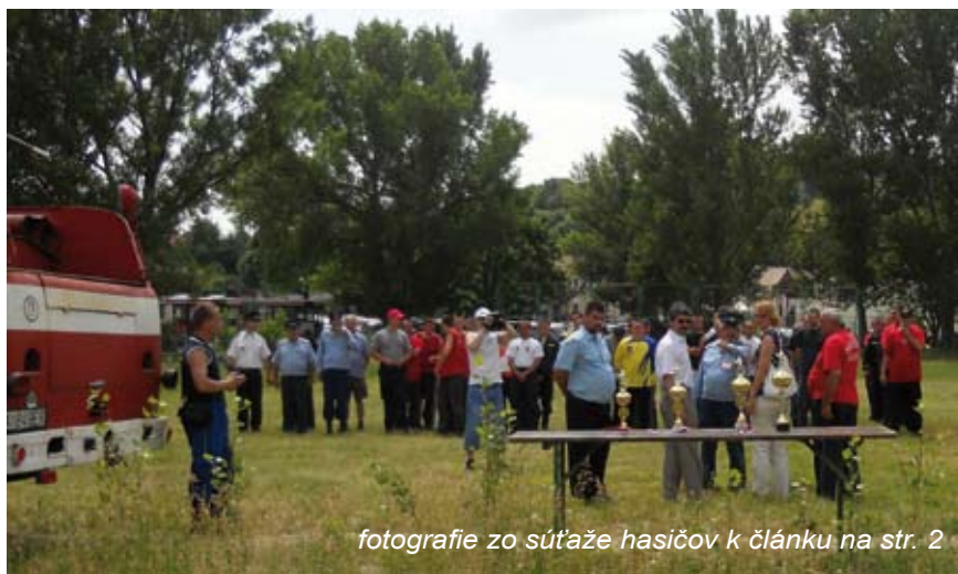
fotografie zo súťaže hasičov k článku na str. 2