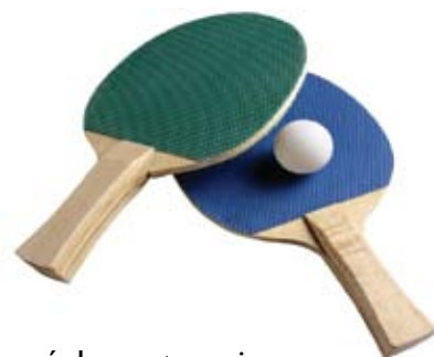
Pozvánka na turnaj