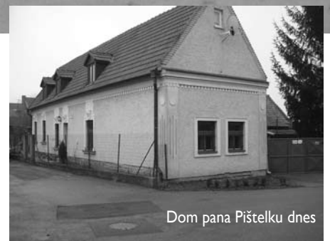
Dom pana Pištelku dnes