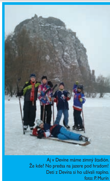
Aj v Devíne máme zimný štadión. Že kde? No predsa na jazere pod hradom! Deti z Devína si ho užívali naplno.

deme všetci v našom vlastnom spoločnom záujme sledovať dianie okolo nás, môže byť aj horšie. Mám na mysli likvidáciu samosprávy v jej dnešnej podobe. Pod zámienukou šetrenia a racionalizácie rôznych úkonov totiž uzreli svetlo sveta všelijaké legislatívne „zlepšováky“.