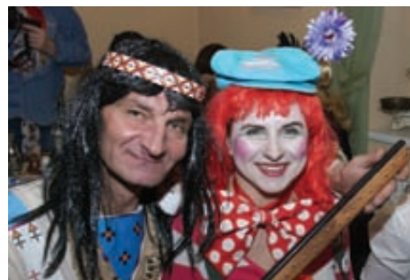
Winnetou v Devíne