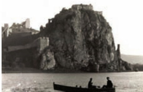
Rozprávanie našej jubilatky