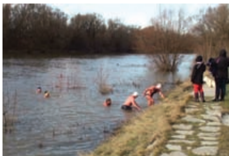
Ľadové medvede v Devíne

Noviny pre obyvateľov Devína • zdarma • február 2013 • 2/2013 • Ročník XI