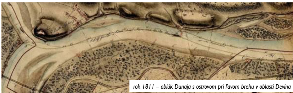
rok 1811 – oblúk Dunaja s ostrovom pri ľavom brehu v oblasti Devína

Čo sa týka samotného Dunaja, v období voľného meandrovania bol veľmi dynamickým tokom, ktorý sa v mnohých oblastiach rozvetvoval do bočných ramien. Koryto Dunaja v oblasti Devína prešlo v minulosti viacerými výraznými úpravami. Najprv boli vybudované obojstranné protipovodňové hrádze, nasledovalo ich zosilňovanie a zvyšovanie. Neskôr si nebezpečné ľadové povodne vyžiadali