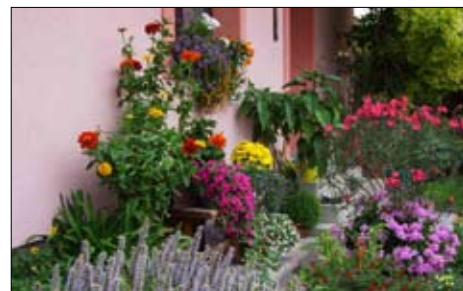
Deň devínskych záhrad čítajte na str. 5