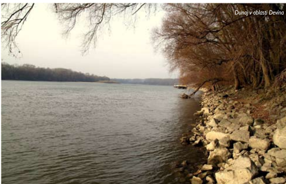
Dunaj v oblasti Devína

Z dôvodu opevnenia brehov Dunaja vysokými násypmi ťažkého kamenia dnes devínske rameno s Dunajom nekomunikuje. Horná oblasť vtoku aj spodná oblasť výtoku sú od Dunaja úplne odrezané a voda do ramena nateká len pri vyšších prietokoch. Cieľom ochranárov z Bratislavského regionálneho ochranárskeho združenia (BROZ) je obnoviť dynamiku prúdenia v ramene jeho otvorením,