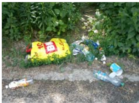
Niektorí rybári zabúdajú po sebe upratať!