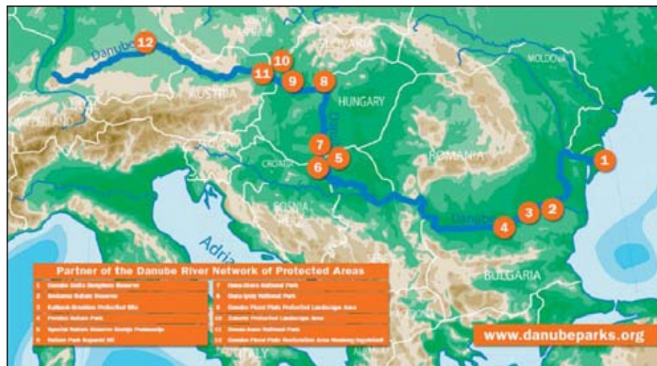
Projektové územie medzinárodného projektu Danubeparks, v rámci ktorého boli navrhnuté revitalizačné opatrenia na devínskom ramene.

Oblasť, v ktorej sa nachádza devínske rameno, predstavuje záujmové územie medzinárodného projektu Danubeparks ( www.danubeparks.org ). Ide o projekt zameraný na ochranu Dunaja, za účelom ktorej sa spojilo 12 chránených území z ôsmich dunajských krajín od Nemecka až po Rumunsko. V rámci projektu pripravuje BROZ v spolupráci s rakúskym Národným parkom Donau-Auen spoločný cezhraničný koncept ochrany a vhodného manažmentu tohto územia. Oživenie vodného režimu devínskeho ramena nepochybne k zlepšeniu prírodných podmienok v cezhraničnej oblasti prispieje.