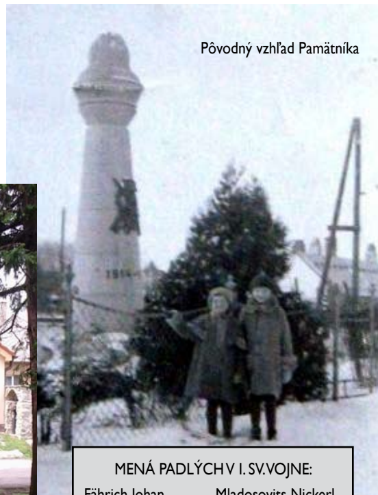
Pôvodný vzhľad Pamätníka