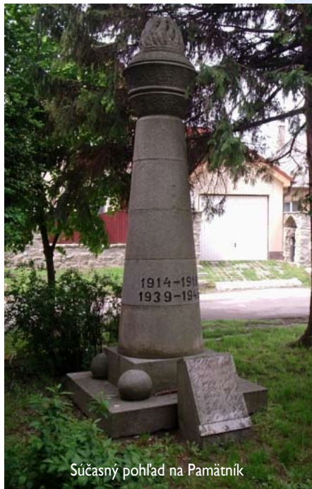
Súčasný pohľad na Pamätník