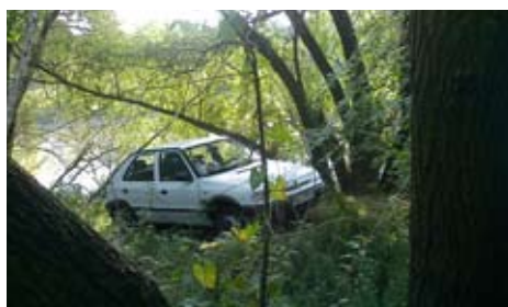
Rybačka priamo z auta