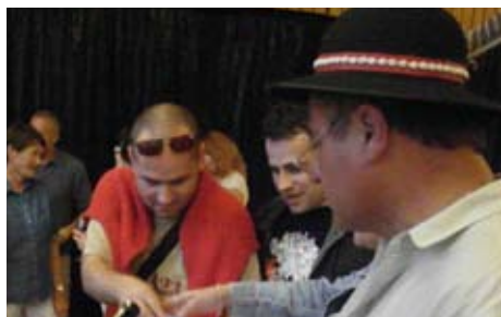
„Červený“ Devínsky stravec čítajte na str. 3

Noviny pre každého Devínčana • zdarma • 4/2011 • Ročník IX