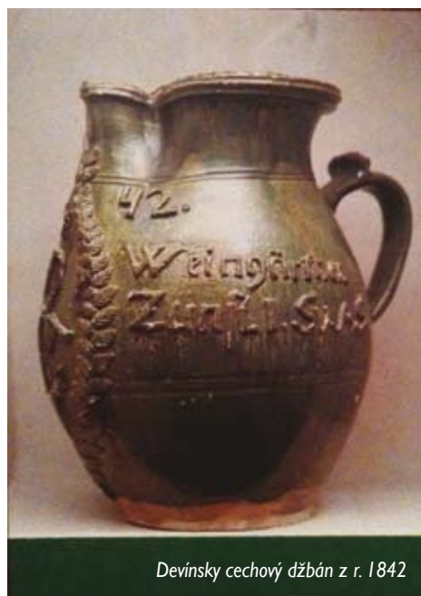
Devínsky cechový džbán z r. 1842