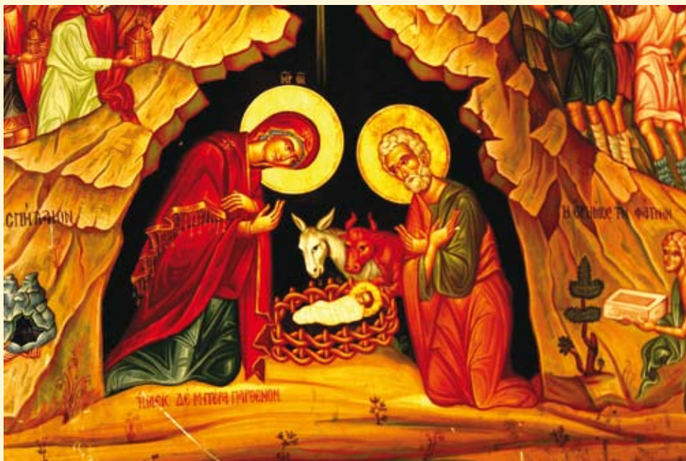
Betlehem, Bazilika narodenia, ikona